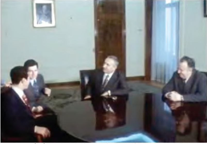
مباحثات عبد السلام جلود مع إدوارد جيريك في بولندا، 8 / 2 / 1974.